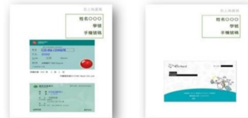
《銀行電子存摺封面》建議